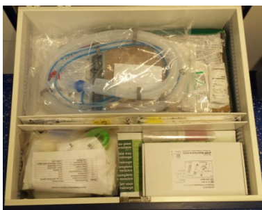
Fach 22 Sterilmaterial (im Einsatz möglichst nicht öffnen)

EZIO Druckbeutel für Infusion („Schnellangriff“ Verband) Amputatbeutel nur Hand und Bein, Arm passt in Bein!